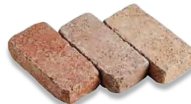
Cod.043 - Casale