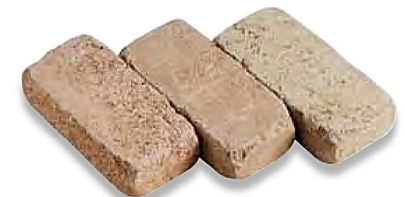
Cod.044 - Paglierino